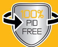
100% PID フリー