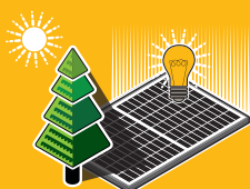
RECの先駆的なツインデザイン